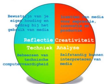
Mediawijsheidcirkel in ideale verhouding

Af en toe vraagt een ouder zich weleens hardop af, wat wij als leerkrachten zoal doen met onze telefoon onder schooltijd. Daarom hier wat verduidelijking. Wij zien de telefoon als een kleine computer, een mini-tablet. Er worden leerlingen geobserveerd en daarover aantekeningen gemaakt in de mini-tablet. Er worden foto's genomen van leerlingenwerk of van leerlingen aan het werk. De foto's worden bewerkt en uiteindelijk geprint of op de schoolapp gezet. De agenda, buienradar, aantekeningen, youtube afspeellijsten, google, pinterest, fotobewerkingsprogramma's, stopwatch en whatsapp (als contactmiddel met ouders of duocollega) worden regelmatig gebruikt. Wanneer een ouder bijvoorbeeld iets meldt bij een leerkracht, dan zal de andere (duo)leerkracht daar ook van op de hoogte worden gebracht, dit wordt meteen gecommuniceerd via whatsapp. De telefoon wordt dus regelmatig ingezet als middel zoals er vroeger van de meeste van deze hulpmiddelen papieren versies of andere apparaten werden gebruikt binnen onze onderwijsorganisatie. Met de komst van de Ipad binnen onze school zal dit alleen maar meer worden. De ene leerkracht gebruikt voor deze zaken dus haar telefoon terwijl de ander prefereert voorlopig nog op papier te werken. Uiteraard hebben wij als team afspraken over privé gebruik van de telefoon.